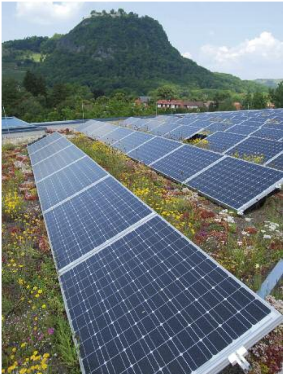
Kombination mit Zukunft – Photovoltaik und Dachbegrünung