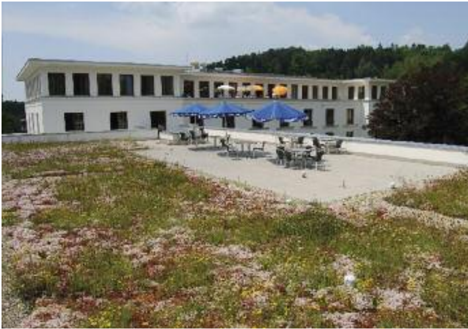
Aus einer einfachen Extensivbegrünung wird ein Treffpunkt – die Dachterrasse eines Pflegeheims in Singen.