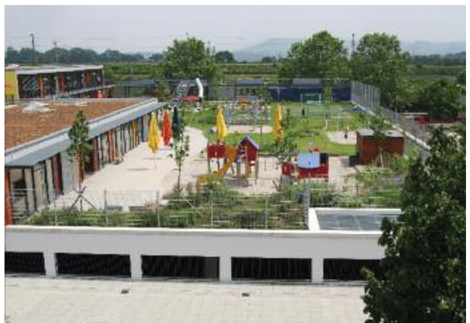
Sport und Spiel auf dem Dach – Kindertagesstätte in Stuttgart-Mitte