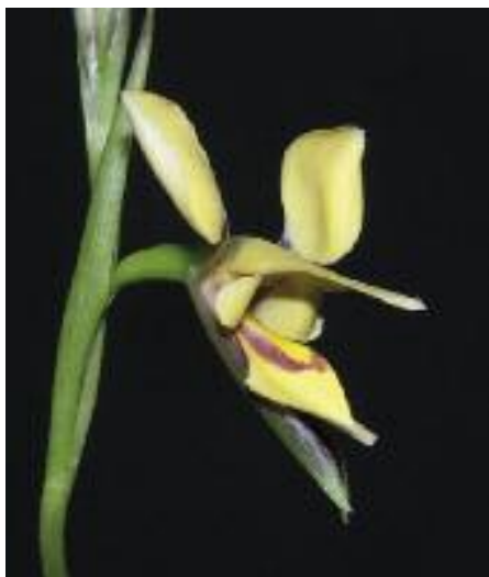
Zu den schönsten Orchideen – hier eine Diuris drummondii – führen die Exkursionen der ZHAW am 18. und 26. Mai.

Die Fachstelle Dachbegrünung der ZHAW bietet im Jahr 2010 ein erweitertes Programm an jeweils eintägigen Fachexkursionen an. Neben dem Klassiker „Swiss Special“ haben die Zürcher das Angebot erweitert mit den Spezialthemen Orchideen sowie Umweltplanung – ökologischer Ausgleich. Die Exkursion Swiss Special ist in den letzten Jahren mehrfach erfolgreich durchgeführt worden und führt heuer unter anderem exklusiv zum Dach des Stücki-Einkaufs-