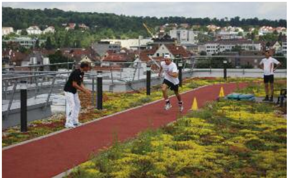
Laufbahn auf einem extensiv begrünten Dach – Bewegung, Gemeinschaft, Natur