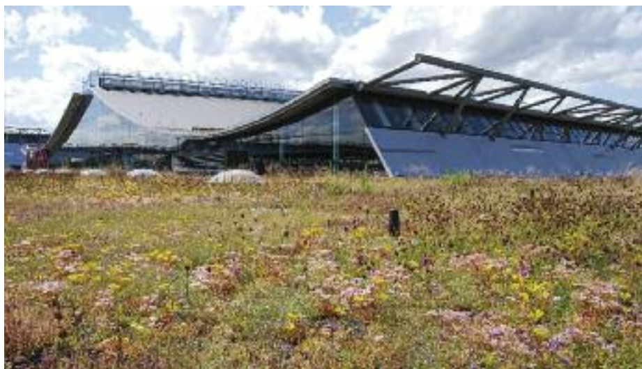
Ökologie, Wasserrückhalt, Architektur – drei Funktionen der Dachbegrünung der Landesmesse Stuttgart