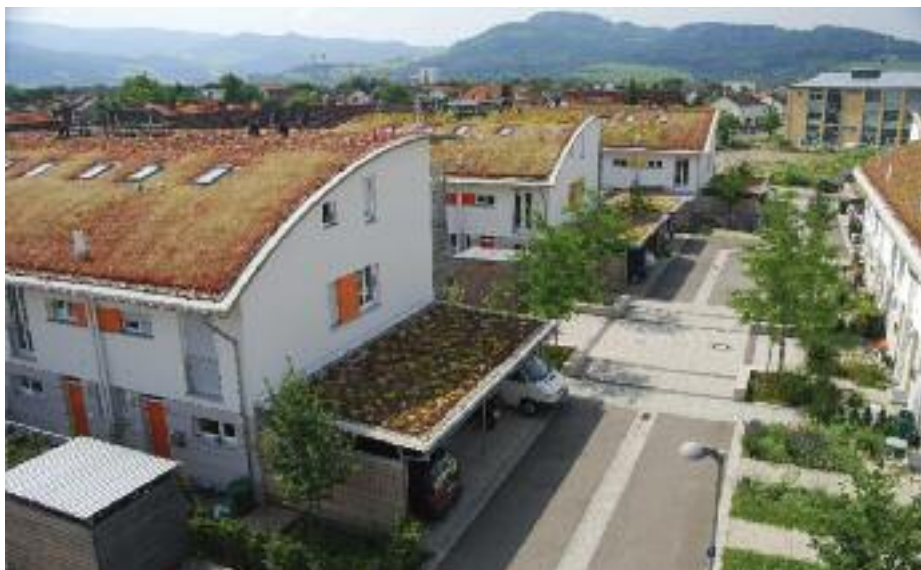
Diese begrünte Siedlung in Freiburg schafft ein lebenswertes Ambiente.

Schon früh in den Anfängen der Dachbegrünung in Deutschland wurden Untersuchungen in den verschiedensten Themenbereichen vorgenommen und diese Erkenntnisse und Praxiserfahrungen in der „Richtlinien zur Planung, Ausführung und Pflege von Dachbegrünungen“, kurz „Dachbegrünungsrichtlinie“, der Forschungsgesellschaft Landschaftsentwicklung Landschaftsbau (FLL) als Stand der Technik zusammengefasst. Damit sind die begrünter extensiven und intensiven Dächer ausreichend behandelt, doch in Deutschland trägt man der aktuellen Entwicklung genutzter Dächer Rechnung und hat 2005 erstmals auch die „Empfehlung zu Planung und Bau von Verkehrsflächen auf Bauwerken“ veröffentlicht. Die „Hinweise zur Pflege und Wartung begrünter Dächer“ von FLL, BGL (Bundesverband Garten-, Landschafts- und Sportplatzbau) und FBB (Fachvereinigung Bauwerksbegrünung) ergänzen die