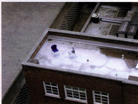
Bild 1. Schaden auf einem Flachdach durch unsachgemäße Nutzung

Neben der Schadensanalyse liefern der Bericht Empfehlungen für nachhaltiges und schadensfreies Bauen. Zwar ist der Report über zehn Jahre alt, doch hat sich an der Situation bis heute wenig geändert. Passiert ist näm-